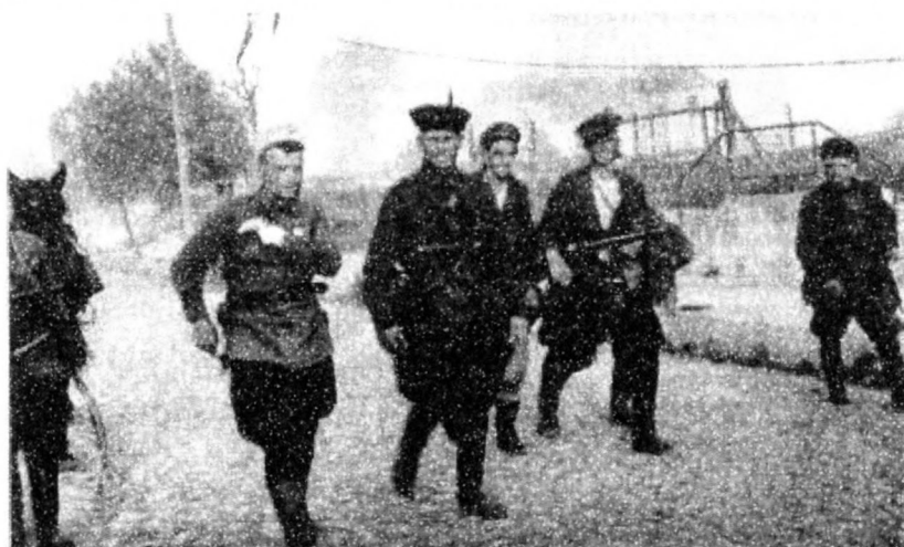
Партизаны на улицах освобожденной Сморгони. 4 июля 1944 г.

района освобождали 16-й и 36-й гвардейский стрелковые корпуса 11-й гвардейской армии.